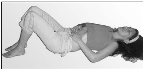
Posición para la respiración profunda