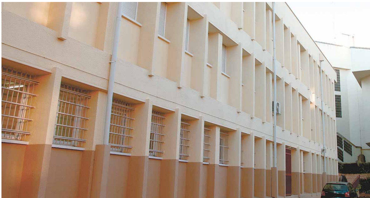
El IES "Renacimiento" se ubica en el madrileño barrio de Carabanchel.

RODRIGO SANTODOMINGO Enclavado en el castizo barrio de Carabanchel, el IES "Renacimiento" se alza como una secuencia de enormes edificios en cuña salpicada de canchas deportivas y naves para enseñanzas profesionales. En el recinto, que acoge a más de 1.600 estudiantes, abunda el hormigón y escasean los árboles. El centro ofrece el surtido completo de estudios de Secundaria: ESO, Bachillerato y un buen puñado de familias de FP. Su alumnado, como en la mayoría de institutos del sur de Madrid, resulta de lo más variopinto, con un alto porcentaje de hijos de inmigrantes y elevadas tasas de chavales que precisan de algún tipo de actuación compensatoria. El origen humilde de las familias se antoja, quizá, el nexo de unión que aglutina al cuerpo estudiantil.